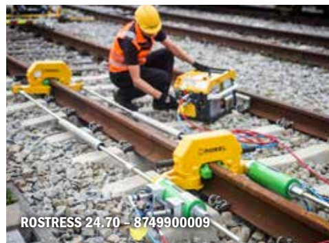
ROSTRESS 24.70 – 8749900009

Modulární koncepce k dosažení neutrálního napětí v kolejnici při svařování a napínání kolejnic.