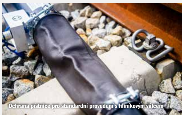
Ochrana píštěnce pro standardní provedení s hliníkovým válcem