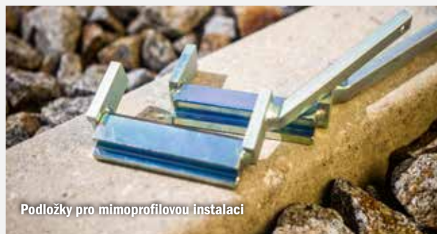
Podložky pro mimoprofilovou instalaci