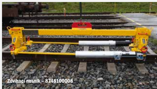
Zdvihací nosník - 8748100008