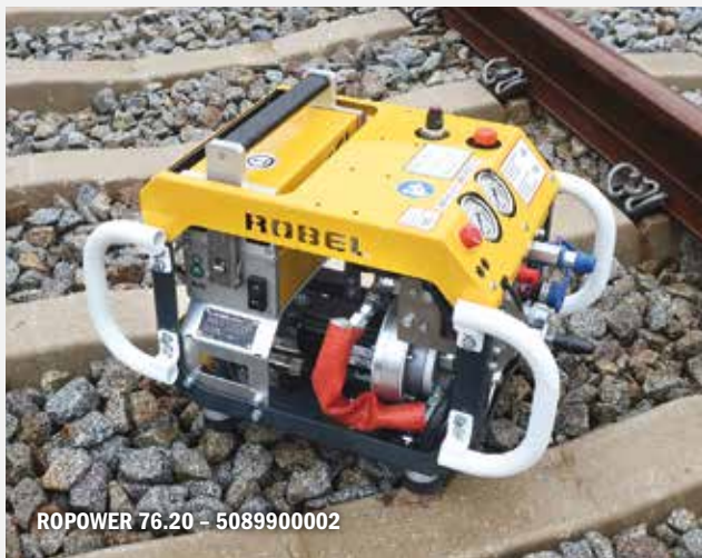
ROPOWER 76.20 - 5089900002

9000860480 Sada hadic pro napínák kolejnic od provedení 8, Nouzové uvolnění tlaku na rozvodném bloku jako standard