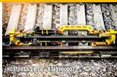
ROSTRESS 24.70 – 8749900007