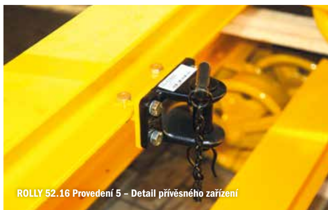
ROLLY 52.16 Provedení 5 - Detail přívěsného zařízení