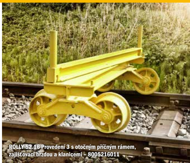
ROLLY 52.16 Provedení 3 s otočným příčným rámem, zajišťovací brzdou a klanicemi - 8005216011