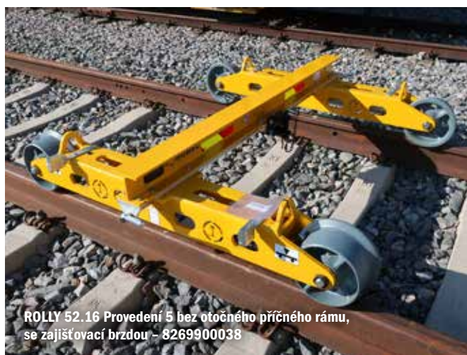
ROLLY 52.16 Provedení 5 bez otočného příčného rámu, se zajišťovací brzdou - 8269900038

8261800005 Zásuvná klanice pro provedení 2, 5 a 6 bez otočného příčného rámu