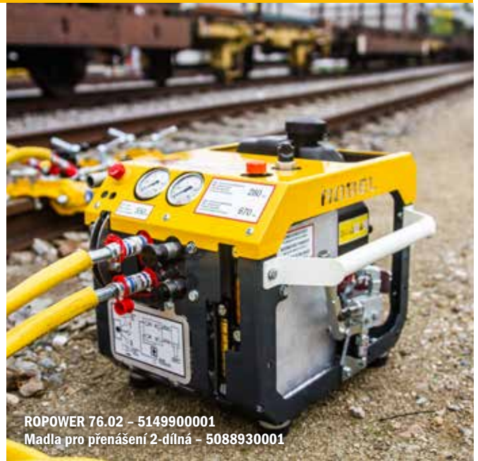
ROPOWER 76.02 – 5149900001 Madla pro přenášení 2-dílná – 5088930001