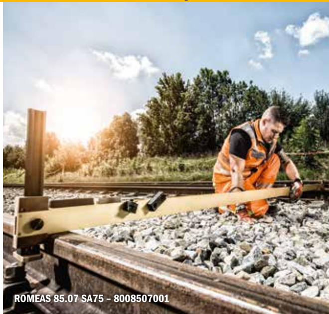
ROMEAS 85.07 SA75 - 8008507001